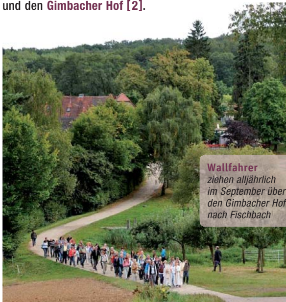
Wallfahrer ziehen alljährlich im September über den Gimbacher Hof nach Fischbach

Doch der drei Kilometer lange Wallfahrtsweg Kelkheim-Fischbach hat auch dem Wanderer, der modernen Form des Pilgers, einiges zu bieten – eine reizvolle Landschaft und zwei Ausflugslokale an der Gundelhard [1] und den Gimbacher Hof [2] .