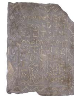
Roteldis-Gravstein 7. Jahrhundert

Historisch sogar noch bedeutender als das Dreifaltigkeitsbild ist der Roteldis-Stein , der ebenfalls in der Seitenkapelle zu sehen ist. Der Grabstein aus dem 7. Jahrhundert – auch auf dem Gimbacher Hof entdeckt – ist Zeugnis für die ersten Christen im Taunus. Außerdem lohnt sich ein Blick auf ein Glasfenster des Hl. Antonius des Einsiedlers (entstanden vor 1400) und das große Dreifaltigkeitsrelief, das aus der Kapuzinerkirche in Frankfurt stammt.