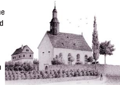
Pfarrkirche in Fischbach, erbaut 1781 Zeichnung von Joseph Albert, 1854

Das Bild zeigt die Aufnahme Mariens in den Himmel und ihren Empfang durch die Heilige Dreifaltigkeit aus Gott-Vater, Gott-Sohn und Heiligem Geist. Die „armen Seelen“, die sich zu deren Füßen im Fegefeuer winden, sind wohl erst 1901 hinzugefügt worden.