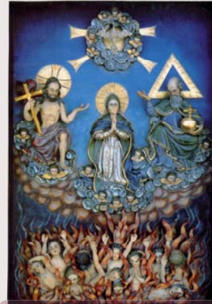
Gimbacher Wallfahrtsbild, 1717 Aufnahme Mariens in den Himmel durch die Hl. Dreifaltigkeit

1287 wurde der Vorgängerbau der Wallfahrtskapelle erstmals urkundlich erwähnt. Sie war Johannes dem Täufer geweiht und schon früh das Ziel von Pilgern: Der Legende nach hatte der Gimbacher Schäfer einen Baumstamm mit dem Bild der Dreifaltigkeit in einem Sturzbach treiben sehen. Er zog es an Land und stellte es in der Gimbacher Johanneskapelle auf. 1335 genehmigte der Vatikan die Verehrung des Bildes.